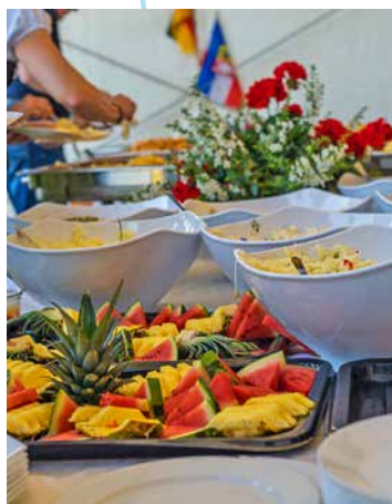
Auch das leibliche Wohl kommt nicht zu kurz – Grillbuffet während der Goldenen Schärpe 2017.