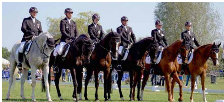
Mannschaftsdressur: Team Austria bei der Ländlichen EM Vielseitigkeit 2015 in Helvoirt (NED).