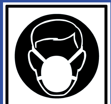
Mund/ Nasenschutz tragen