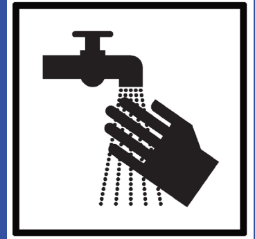
regelmäßig Hände waschen