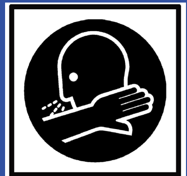
In die Armebeuge niesen